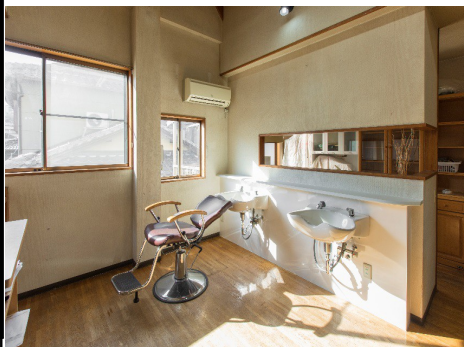
トレーニングセンター